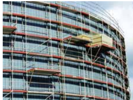
Isolation d'un bac

Notre réactivité et notre disponibilité, grâce à la souplesse d'une équipe à dimension humaine, ont amené nos meilleurs clients (TOTAL, EDF, LE PORT AUTONOME...) à nous confier la gestion de leurs principaux contrats de maintenance. Leur confiance est confortée par notre personnel constitué de professionnels motivés, qui savent assurer des interventions 24h/24.